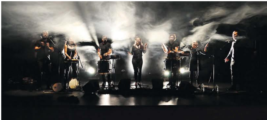
Barrut ? Un tsunami polyphonique

Dans le cadre du festival Convivencia (du 2 juillet au 26 juillet), reprenez une date ; celle du mardi 5 juillet à 20h pour l'étape ramonvilloise (Port-Sud) pour un spectacle de Barrut. Les chanteurs et chanteuses de Barrut qui se produiront s'inscrivent avec force dans le mouvement des nouvelles polyphonies occitanes